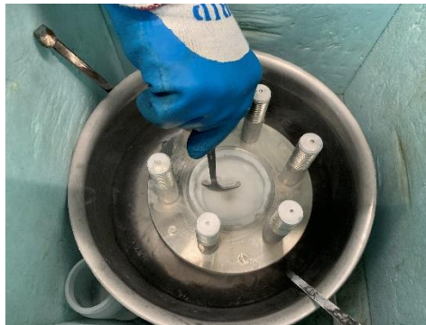
解析用サンプルハイドレート採取の様子

ハイドレートの結晶構造はその熱力学的物性に大きな影響を及ぼす因子である。実際にハイドレートを生成して結晶サンプルを採取し、粉末 X 線解析測定による結晶構造の特定とその物性を実験的に測定した。この結果は New Journal of Chemistry に掲載されている。