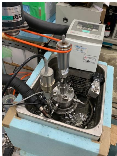
相平衡条件測定装置

ハイドレートの相平衡条件，分解熱を実験により測定した。相平衡条件とはハイドレートが液相と気相とで共存できる温度 - 圧力条件のことを指す。相平衡条件はいわばハイドレートの生成条件であり将来的な実用化に向けて重要な物性値である。分解熱は示差走査熱量測定によりサンプルハイドレートの分解熱を測定した。これらの結果は Journal of Power Sources 等に掲載されている。