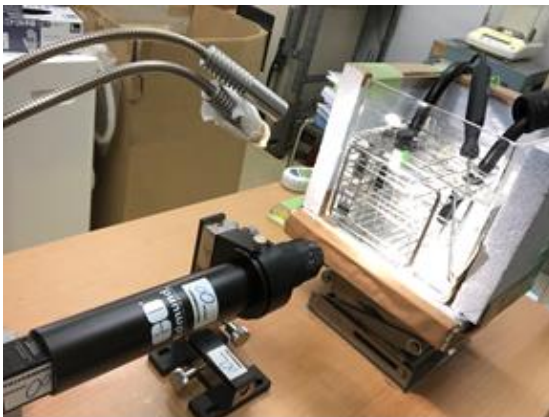
結晶学的動特性観察装置 1

先行研究により解明されたハイドレートの相平衡条件に基づきハイドレートの結晶成長挙動およびモルフォロジーの観察を行った。ハイドレート生成・分解に関する動的特性の解明はハイドレートエンジンの実機考案および設計に有効な知見になると考えられる。これらの結果は Crystal Growth Design に掲載されている。